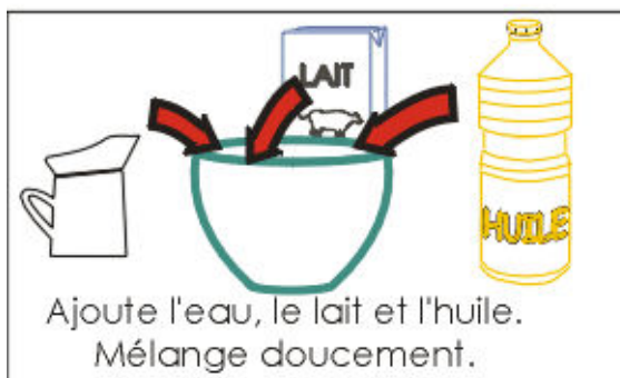
Ajoute l'eau, le lait et l'huile. Mélange doucement.